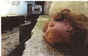
'Kop van pop'.